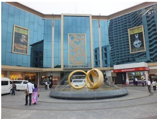
【道路側リバーシティ正面玄関】